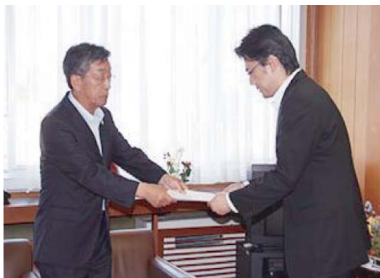
藤田会頭より名寄市長へ提言書提出