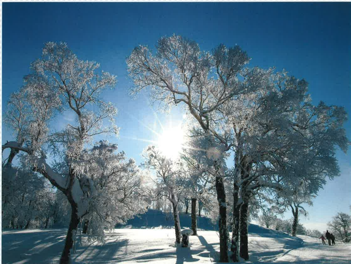
サンピラー（ピヤシリスキー場）