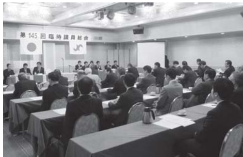
第145回臨時総会 於、グランドホテル藤花

決に向け、重点事業・特別事業、事業細目の計画事業を設定し、取り組みを進めてまいります。