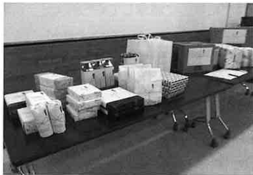
ご提供頂いた景品の一部

来年度以降、より楽しんでいただけるような事業の実施に向け、コロナの状況を見ながら段階的に開催方法を検討していきたいと思しますので、何卒ご理解いただき、引き続きご協力いただけますようお願いいたします。