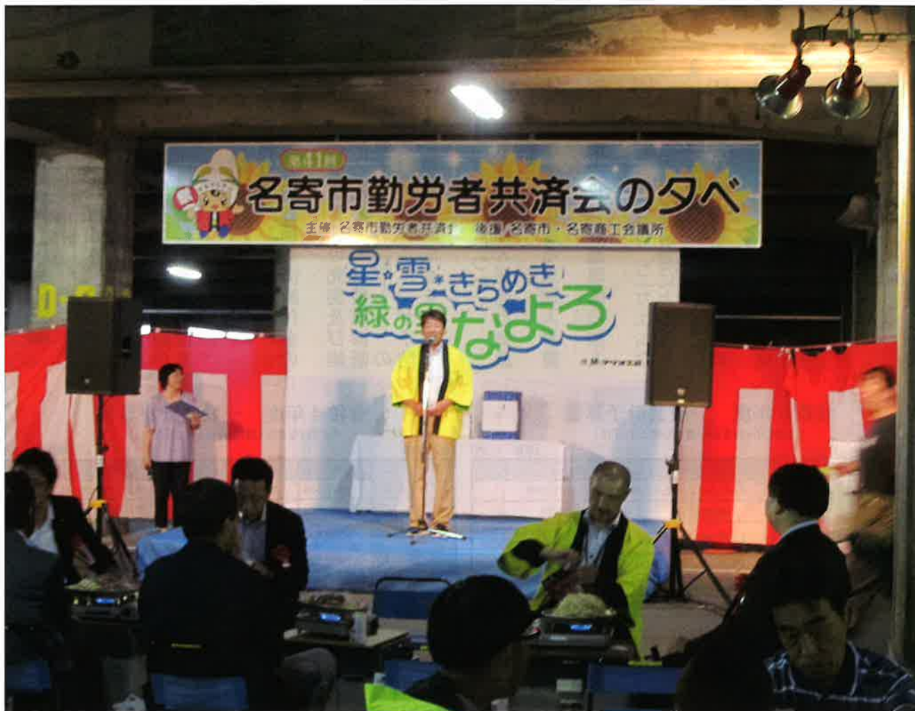
「共済会の夕べ」が4年ぶりに通常開催