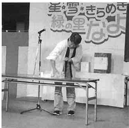
実行委員長賞の抽選