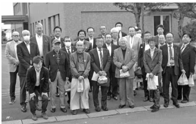
※裁判所の施設内は写真撮影禁止

員などが座ることがあります。左右の席はそれぞれ検察官や弁護士の席となり、その後に傍聴席が設けられています。傍聴は原則自由です。