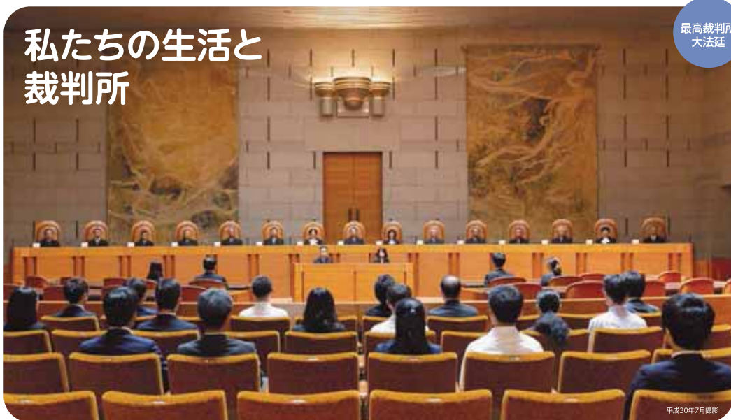
最高裁判所 大法院