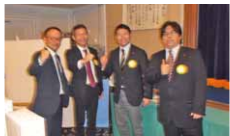
親睦活動委員会が一丸となって準備しました