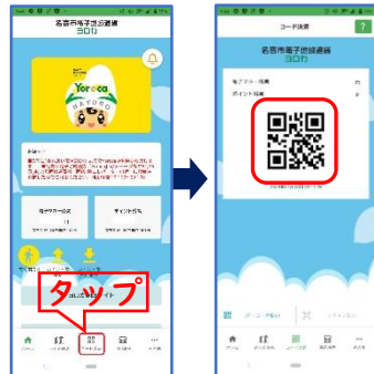
スマホ Yoroca アプリ