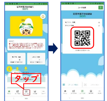
スマホ Yoroca アプリ