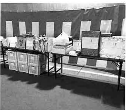
ご提供頂いた景品