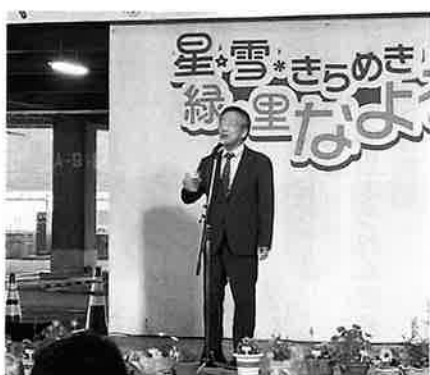
藤田会議所会頭の祝杯