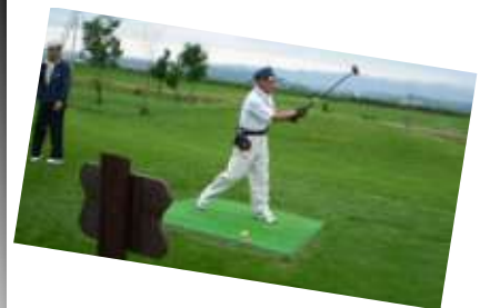
皆さんナイスショット！

・その他にも優良従業員表彰式、会議所議員の専門部会による視察研修では、商業振興委員会と運輸観光委員会合同で今後のイベント事業に資するための視察を行い、今年開催の大道芸のイベントへと結びつきました。また、工業振興委員会では農商工連携・産学官連携を目的に帯広畜産大学等を視察研修し今後の事業に役立ちました。 ・中小企業対策としては、中小企業相談所にて経営指導の充実を図り、各種融資の斡旋、確定申告等の税務相談、研修会の開催、労働保険相談、交通量・空き店舗等の調査研究、緊急雇用安定助成金相談会等を推進しました。 尚、詳しい事業報告書につきましては当所ホームページに掲載されていますのでご覧ください。