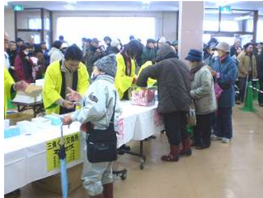
12月に地域商品券販売！長蛇の列

・名寄の農畜産品から農畜産加工品まで幅広くブランド化を目指すため「なよろブランド創出事業」として勉強会・セミナー・研究会を行いました。地域ブランド・企業ブランドの確立の重要性を再認識し、今年度の名寄ブランド新商品開発事業への足がかりとなりました。