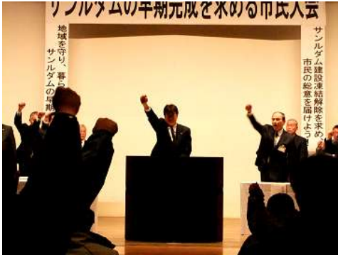
サンルダムの早期完成を求める市民大会

・自衛隊の現体制維持（自衛隊体制維持を求める全道大会への参加他）、サンルダムの早期完成（サンルダムの早期完成を求める市民大会他）、高速道路未整備区間の早期着手、名寄市の行政施策要望など、等関係機関へ地域振興のための意見要望活動を積極的に行いました。